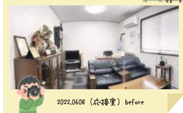
2022.0608 (応接室) before

応接室がついに生まれ変わります…! 今からちょうど1年前。私(筆者)も会議用の机や椅子を見に行きました。机は変形できるものやホワイトボードになるようなもの、椅子は座り心地のよいものなど、様々な種類が置いてあり、とても貴重な時間となりました。月日を経てようやく、リニューアル内容と日程が決定しました! 壁紙や床材なんかも担当者の方と話し合い、いよいよ実行という形になりました。なんだか寂しい気もしますが…。どんな応接室になるのかとっても楽しみです! before 写真も記念に社内報の中に残しておきましょう。みなさんも本社に来る機会があれば応接室を覗いてみてくださいね♪